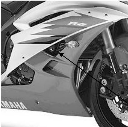
PUNTO DE FIJACIÓN SUPPORT POINT